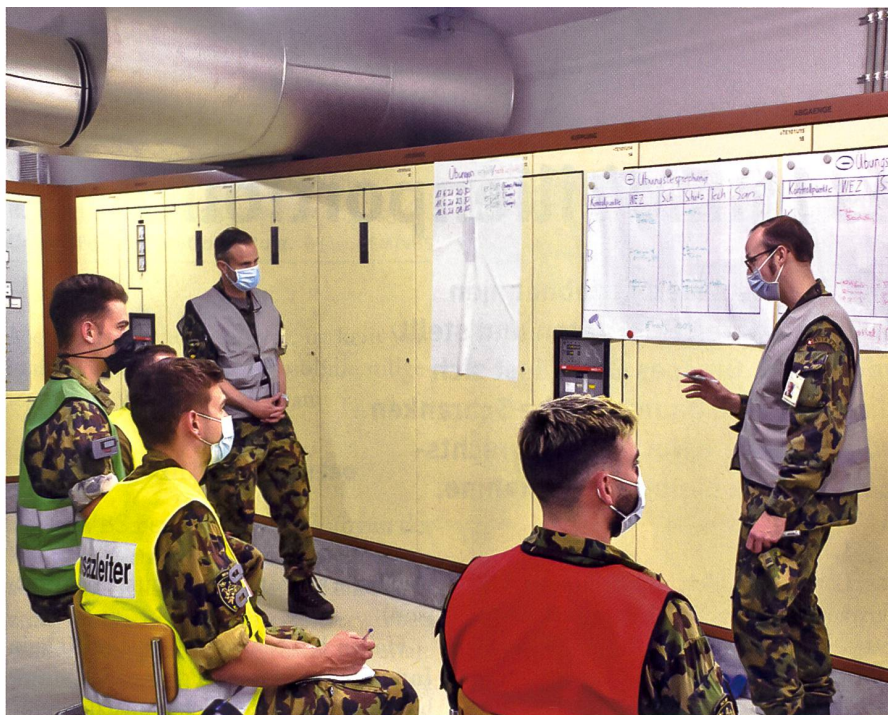
Übungsbesprechung im Inneren der Anlage.

handen beziehungsweise es musste viel neu beschafft werden. Aufgrund der Unterbesetzung im Stab mussten wir sehr polyvalent agieren, wodurch viel gelernt wurde. Da wir aber in dieser «alten» Anlage stationiert waren, konnten wir den Schlauchdienst der Betriebsfeuerwehr benutzen. Es konnten Übungen mit Druck auf der Leitung («scharfem Schuss») durchgeführt werden, was in einer «neuen», klassifizierten Anlage nicht möglich wäre. Für mich ist das Spannendste, die Soldaten auf den gleichen oder besseren Wissensstand wie im WK davor zu bringen.