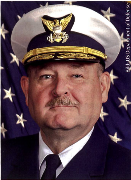
Admiral Thad Allen.