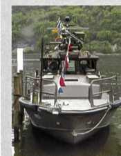
Neues Patrouillenboot