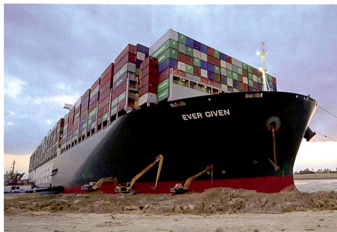
Containerschiff Ever Given blockiert den Kanal.