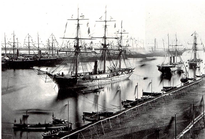
Eröffnung des Suezkanals am 17. November 1869.