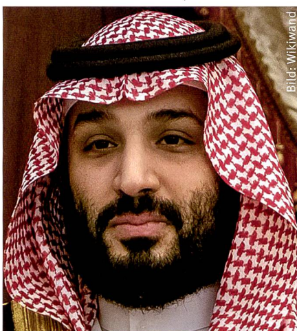
Mohammed Bin Salman Kronprinz, Saudi-Arabien