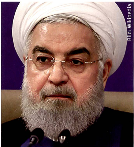
Hassan Rohani Präsident der islamischen Republik Iran