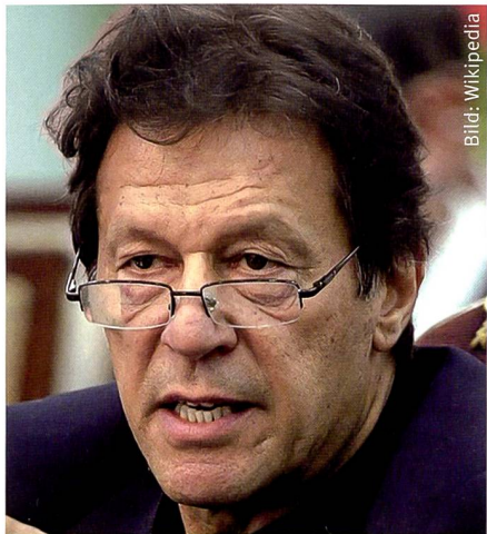
Imram Khan Pakistans Premierminister

Wenige Tage nach dem pakistanischen Regierungschef besuchte der damalige irakische Premierminister Adel Abdul Mahdi Saudi-Arabien und sprach mit MBS ebenfalls über das Verhältnis Saudi-Arabiens zum Iran und erklärte nach sei-