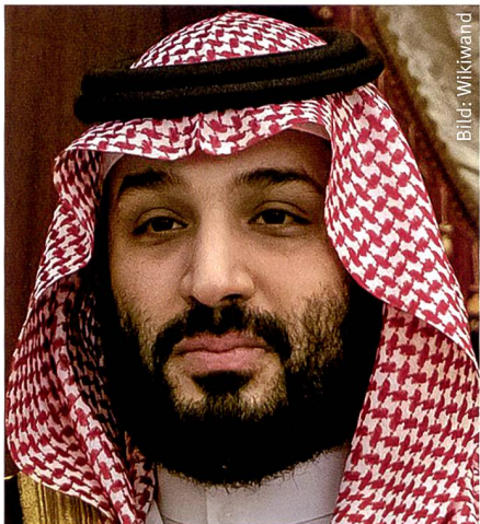
Mohammed Bin Salman Kronprinz, Saudi-Arabien