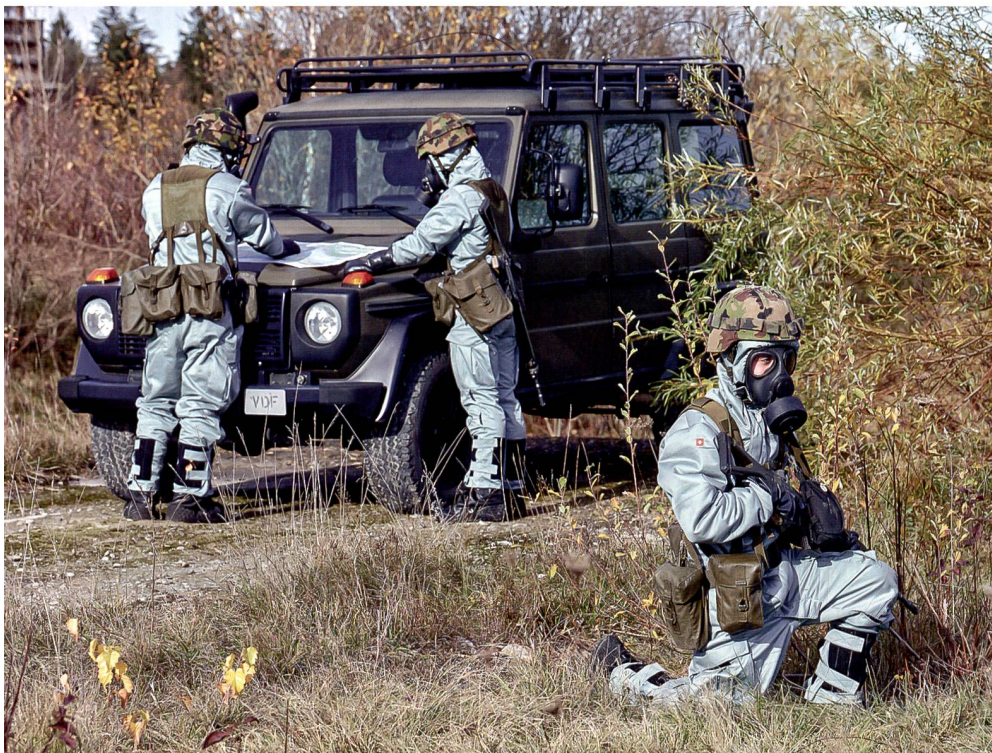
Neue individuelle ABC-Schutzausrüstung.

ausbildung, Erhöhung der Bereitschaft, Stärkung der regionalen Verankerung und vollständige Ausrüstung. Gerade dieser letztgenannte Pfeiler wankt praktisch seit Anbeginn bedenklich: Aus Kostengründen können wichtige Systeme nicht vollständig beschafft werden. Die Beschaffungs-Bugwelle wegen Bestandeslücken