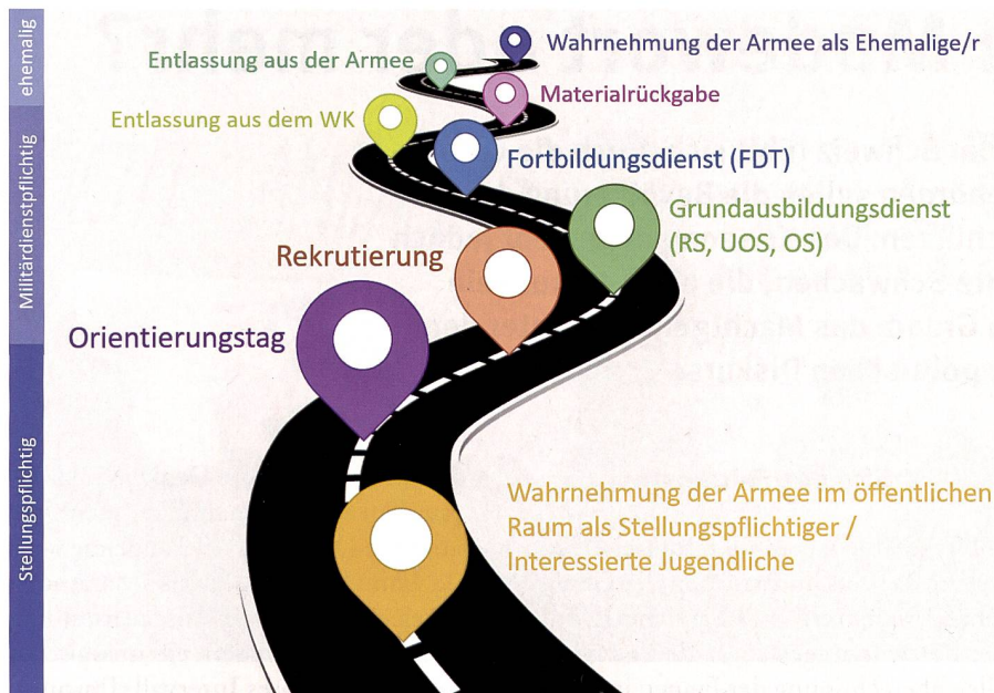
Eine Übersicht über die Touchpoints mit der Armee.