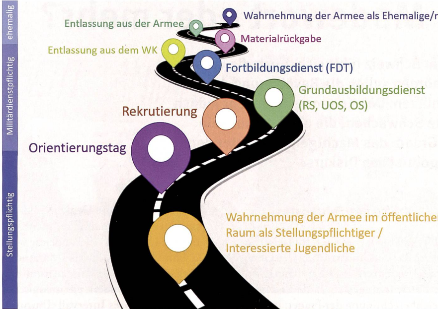
Eine Übersicht über die Touchpoints mit der Armee. Grafik: Autor

mee adressatengerecht organisiert und erfüllen sie das beabsichtigte Ziel?