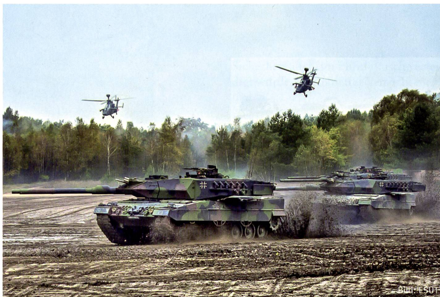
Die Rückkehr der Bundeswehr zur vollen Einsatzbereitschaft ist notwendig.

des Kalten Krieges erkennbar. Heute muss auch danach gefragt werden, welche Rolle Multinationalität und gesamteuropäische Vorstellungen in der gegenwärtigen Struktur spielen, und wie sie sich auswirken könnten. Auf der Korpssebene hat heute die Multinationalität Einzug gehalten, wie dies unter anderem in Münster, Strassburg und Stettin sichtbar ist.