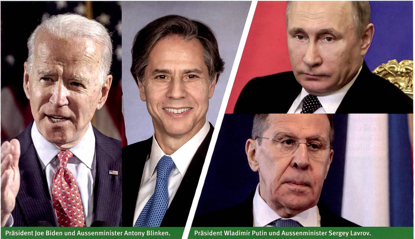
Präsident Joe Biden und Aussenminister Antony Blinken.