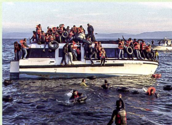
18 Syrische und irakische Flüchtlinge vor Griechenland