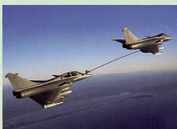
32 Luftbetankung zwischen zwei Rafale