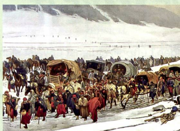
48 Internierung der Bourbaki-Armee