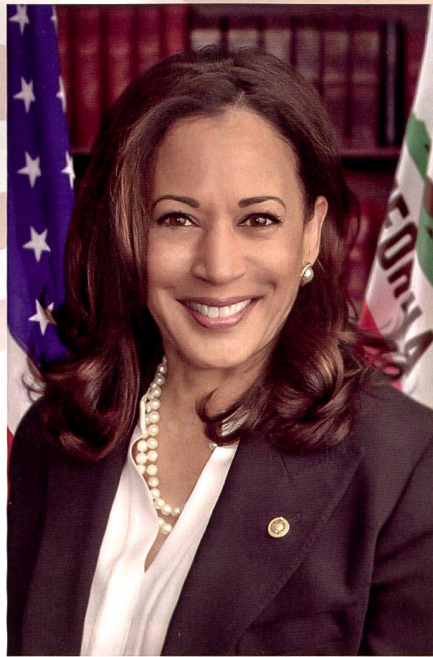
Vize-Präsidentin Kamala Harris.

bereiten Verbündeten suchte, die ihr sicherheitspolitisch zur Seite stehen würden.