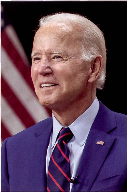
Präsident Joe Biden.