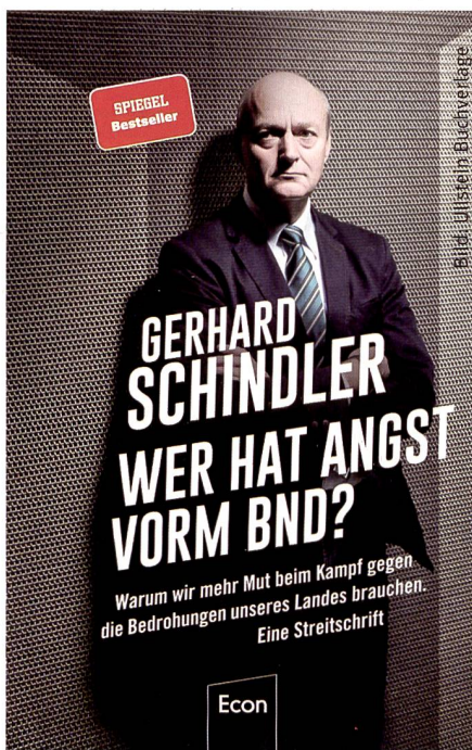
Wer hat Angst vorm BND?

Die Stärke des Buches ist, dass es von der Politik unliebsame Fragen in brutaler Offenheit darlegt und dabei nicht scheut, die Problematik bis auf ihren Grund zu