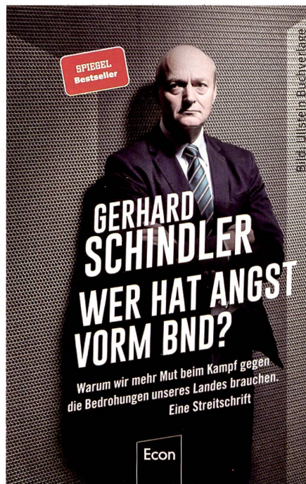
Wer hat Angst vorm BND?

Die Stärke des Buches ist, dass es von der Politik unliebsame Fragen in brutaler Offenheit darlegt und dabei nicht scheut, die Problematik bis auf ihren Grund zu