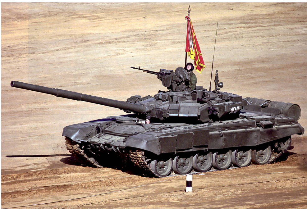
Die armenischen Truppen sollen über 185 Panzer durch Drohnenbeschuss verloren haben.