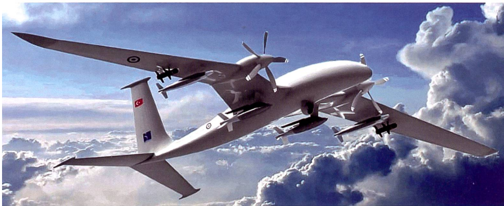
Die türkische Kampfdrohne Bayraktar hat den Krieg für Aserbaidschan mit entschieden.