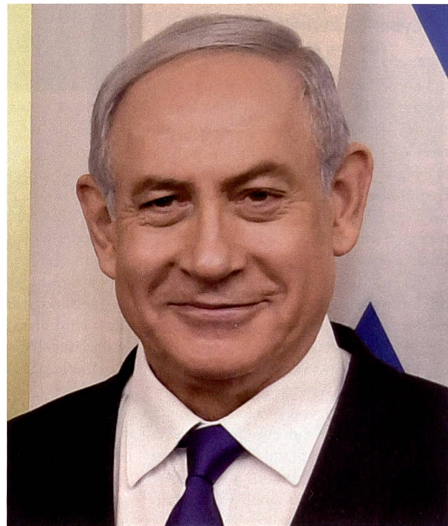
Premierminister Benjamin Netanjahu, Israel.

Seit 1991 sind amerikanische Truppen in den VAE stationiert, und die VAE beteiligten sich an der Seite der Amerikaner am Kampf zur Befreiung Kuwaits,