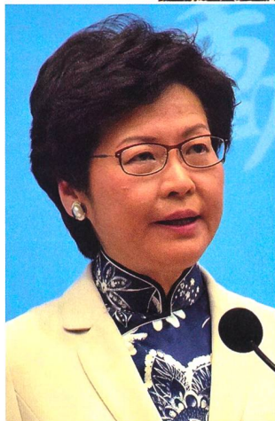
Carrie Lam, bisherige Chief Executive Sonderverwaltungszone Hongkong.

für ungültig erklärt. Peking musste dann zurücksrudern. 2003 wurde die Hongkong-Regierung dann von der chinesischen Staatsführung