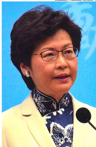
Carrie Lam, bisherige Chief Executive Sonderverwaltungszone Hongkong.

Der erste konkrete Konflikt zwischen den Menschen in Hongkong und der chinesischen Regierung geht auf den Souveränitätswechsel im Jahr 1997 zurück. China hatte damals das lokale repräsentativ-demokratische System quasi