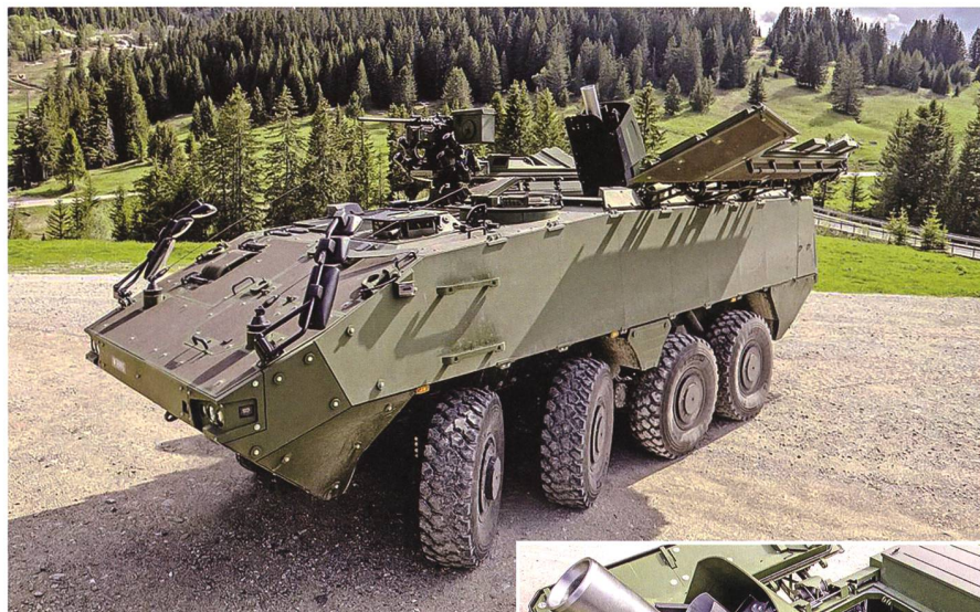
Pantermörser 16 mit geöffneten Geschützraum-Deckeln.

Am 24. April 2020 veröffentlichte die armasuisse ohne Kenntnis und Zustimmung der in die Überprüfung der Truppentauglichkeit des Panzers involvierten militärischen Stellen eine Medienmitteilung, der Pantermörser 16 sei truppentauglich. Dies entsprach nicht dem erst am 25. Mai 2020 unterzeichnet vorliegenden Bericht über die Ergebnisse des im März 2020 erfolgten Truppenversuchs. Darin wurde der Pantermörser 16 als nur «bedingt truppentauglich» qualifiziert. Diese Beurteilung überzeugt allerdings nicht aufgrund der festgehaltenen Ergebnisse der vorgenommenen Prüfungen und aufgrund der nicht durchgeführten Kontrollen. 5 Die verfrühte und falsche Medienmitteilung der armasuisse ermöglichte insbesondere folgende, aufgrund des EFK-Berichts naheliegende Argumentation beziehungsweise Schutzbehauptung: Zwar habe die EFK Unregelmässigkeiten bei der Beschaffung des Pantermörzers 16 gerügt; dennoch liegt nun ein brauchbares, truppentaugliches Waffensystem vor.