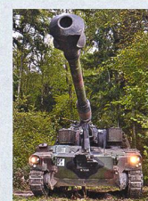
WK 2020 der Art Abt 10