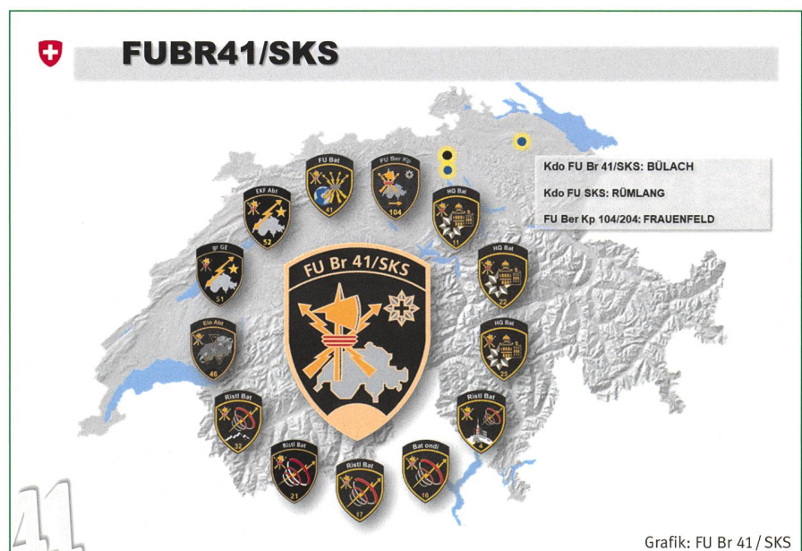
Grafik: FU Br 41/SKS

tert das umfangreiche Corona-Schutzkonzept bis Stufe Kp und zeigt uns die «pocket card» zur Bekämpfung des Corona Virus, welche jeder AdA auf sich trägt. Der Oberfeldarzt hat die sanitärische Eintrittsmusterung unter SARS-CoV-2 mit Tests beim Einrücken und strikten Hygienemassnah-