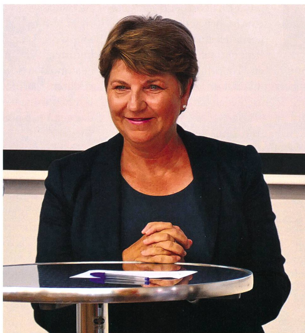
Die Chefin VBS, Viola Amherd, am Kick Off «FiT Frauen im TAZ» in der Guisan Kaserne Bern.

rede. «Am 16. Februar des laufenden Jahres hielten wir eine kleine Gründungsfeier mit 13 Mitgliedern in Bern ab. Sieben Monate später zählen wir im TAZ stolze 72 Frauen und starten in Anwesenheit