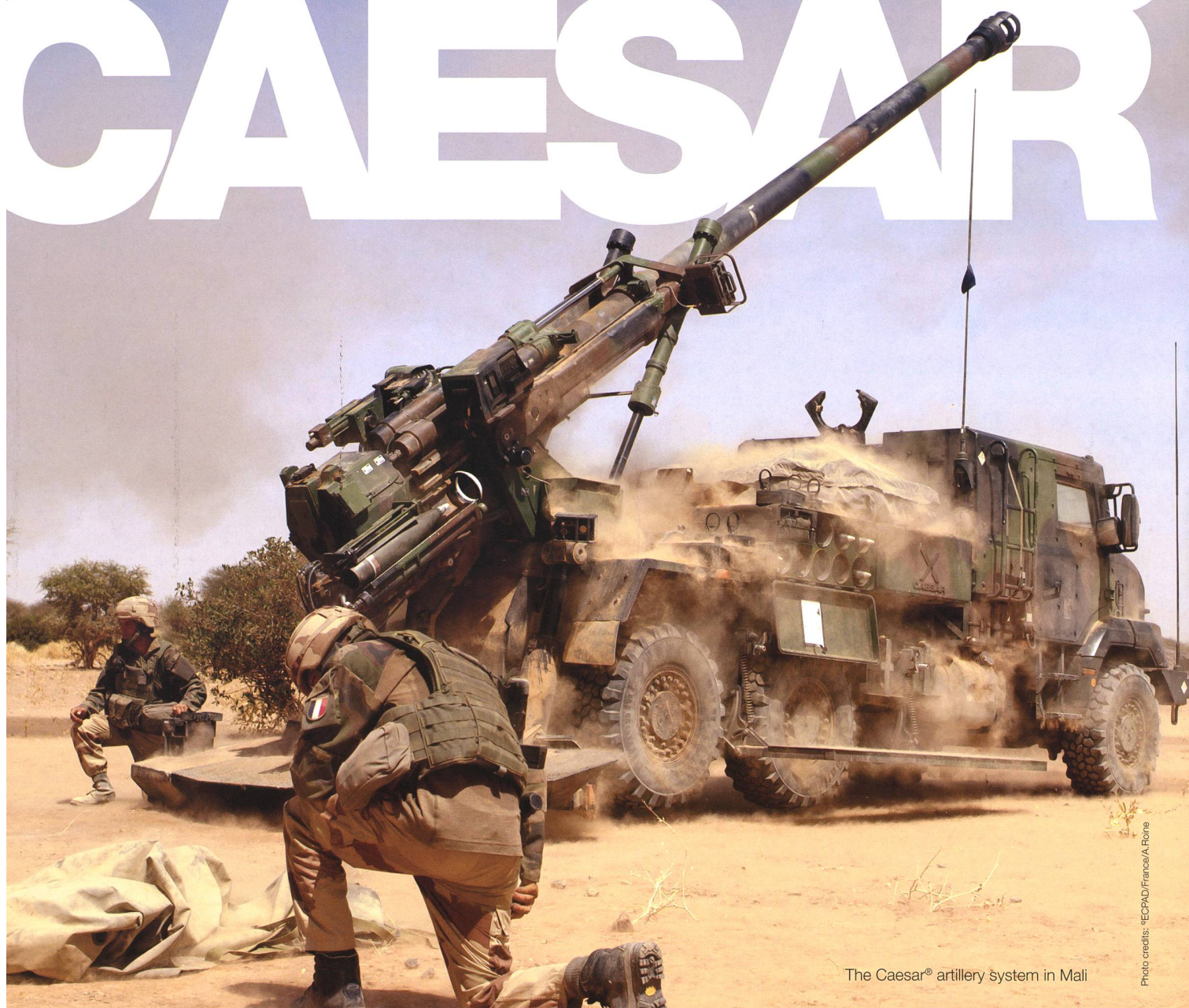
The Caesar ® artillery system in Mali