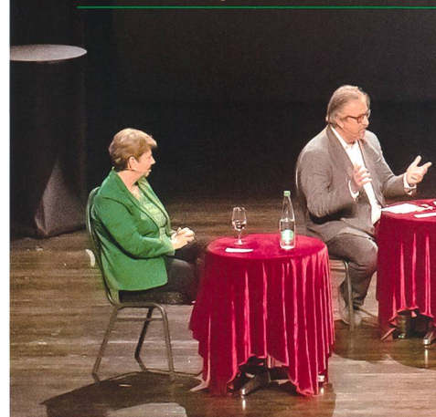
Die grosse Diskussionsrunde während eines Beitrags von NR Beat Flach.

mee als Ganzes aufs Spiel. Da es jetzt zutraf, schien das Argument verbraucht.