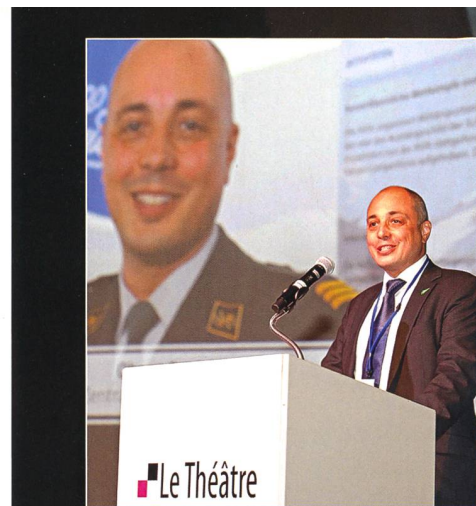
Oberst Patrick Richter, Präsident der AVIA, bei der Eröffnung.

Beginnen wir selbstkritisch mit den Befürwortern: Sie scheuten sich lange klar zu sagen, dass die Verteidigungsarmee schlicht der Vergangenheit angehört, wenn man ihre Luftwaffe nicht rechtzeitig ersetzt. War die dahinterstehende Furcht wirklich begründet, deutliche Worte könnten noch unschlüssige Zeitgenossen gewissermassen aus Trotz ins gegnerische Lager treiben? Was halten wir von der Mündigkeit des Stimmbürgers? Wenn die Scheu vor klarer Ansage berechtigt war, mag der Vorwurf zutreffen, man habe in der Vergangenheit zu häufig damit gedroht, das Scheitern dieses oder jenes einzelnen Vorhabens setze die Ar-