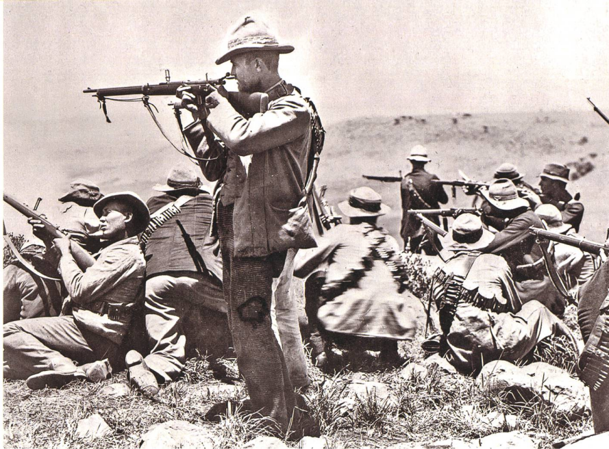
Britischer Tycoon Cecil Rhodes führte Grossbritannien in den Krieg.

rie, die zum Frontalangriff blies, um ihre Ehre zu wahren, empfindliche Verluste zu. Doch mussten die Buren in offenen Feldschlachten mit der Zeit unterliegen, denn allzu krass waren ihre personelle und waffentechnische Unterlegenheit. So verlegte man sich seitens der beiden Freistaaten zunehmend auf eine Art Guerilla-Taktik und fügte dem britischen Feind aus Hinterhalten empfindliche Verluste zu. Zudem wandten sie die Strategie der «verbrannten Erde» kompromisslos an, was den Briten Nachschubschwierigkeiten bereitete. Die Einheimischen kannten natürlich das teilweise schwierige Gelände wie ihren Hosensack, waren gegenüber endemischen Krankheiten eher resistent und kamen auch mit den teilweise extremen klimatischen Verhältnissen besser zurecht als die Nordeuropäer aus Birmingham oder Glasgow. Viele Briten erkrankten, zum Teil akut, zum Teil chronisch. Manche starben sogar an diesen Krankheiten.