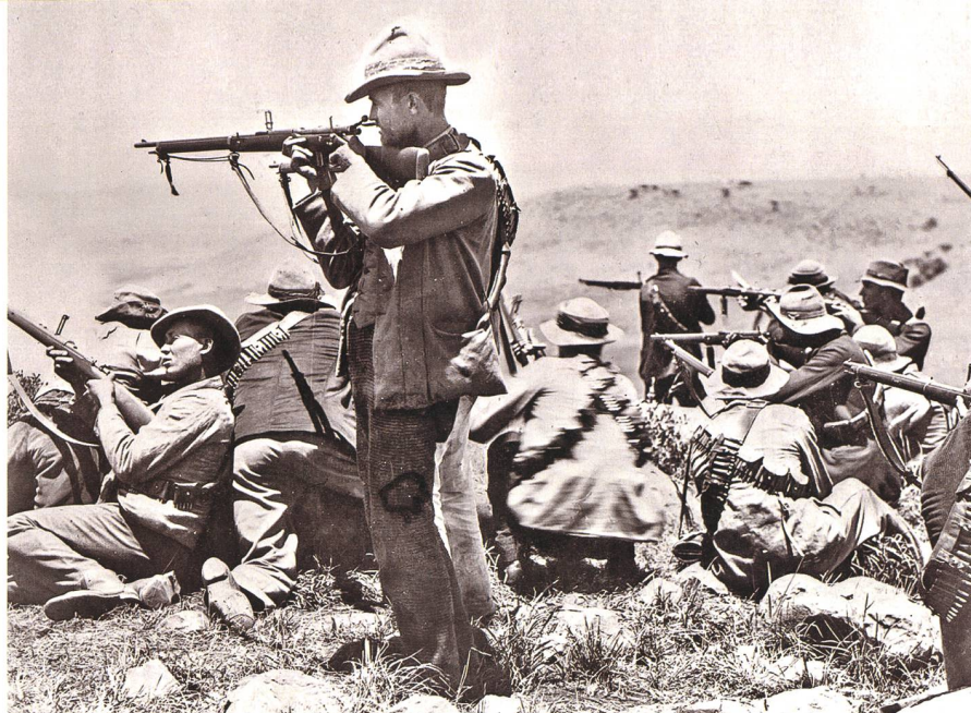
Britischer Tycoon Cecil Rhodes führte Grossbritannien in den Krieg.

rie, die zum Frontalangriff blies, um ihre Ehre zu wahren, empfindliche Verluste zu. Doch mussten die Buren in offenen Feldschlachten mit der Zeit unterliegen, denn allzu krass waren ihre personelle und waffentechnische Unterlegenheit. So verlegte man sich seitens der beiden Freistaaten zunehmend auf eine Art Guerilla-Taktik und fügte dem britischen Feind aus Hinterhalten empfindliche Verluste zu. Zudem wandten sie die Strategie der «verbrannten Erde» kompromisslos an, was den Briten Nachschubschwierigkeiten bereitete. Die Einheimischen kannten natürlich das teilweise schwierige Gelände wie ihren Hosensack, waren gegenüber endemischen Krankheiten eher resistent und kamen auch mit den teilweise extremen klimatischen Verhältnissen besser zurecht als die Nordeuropäer aus Birmingham oder Glasgow. Viele Briten erkrankten, zum Teil akut, zum Teil chronisch. Manche starben sogar an diesen Krankheiten.