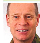
Brigadier Peter Baumgartner Kdt Zentralschule 6000 Luzern 30

Moderne, handlungsorientierte Führungsausbildung wird in Zukunft für gute Führungskräfte entscheidend sein. Das ZFA unterstützt diese Entwicklung massgeblich mit Ausbildung, Prüfung und Zertifizierung der entsprechenden Kompetenzen – mit Vorteilen für Militär und Zivil gleichermassen. Die gut ausgebildeten und reflektierten Milizkader zeigen den Mehrwert der Führungsausbildung nicht nur in der Armee, sondern auch in der Gesellschaft und Privatwirtschaft. Sie sind das Aushängeschild und können stolz sein auf ihre Ausbildung bei der Schweizer Armee.