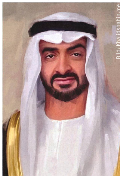
Mohammad Bin Zayid Al Nahayan.