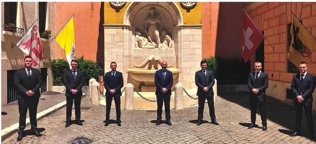
Die Rekruten der Sommer-Rekrutenschule.

Im Herbst verschieben sie sich, zusammen mit der Herbst-RS, auf den Waffenplatz nach Isonne, wo sie bei der Kantonspolizei im Tessin das Sicherheitstraining absolvieren. Folgende Themen werden dabei behandelt: Elemente der Psychologie und des Rechts, Brandbekämpfung, lebensrettende Sofortmassnahmen, Schiessausbildung, persönliche Sicherheit, taktisches Verhalten und Sport. Am Ende dieser Ausbildung werden die Gardisten in den Vatikan zurückkehren und den Dienst fortsetzen. dk