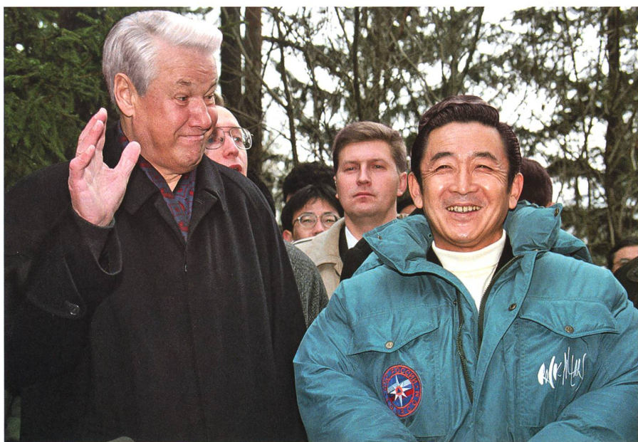
Der russische Präsident Boris Jelzin und der japanische Ministerpräsident Ryutaro Hashimoto, 1977.

Auf ihrer Konferenz in Kairo, Ende 1943, hatten die Alliierten festgelegt, das Kaiserreich müsse alle Gebiete aufgeben, die es mit «Gewalt und Habgier» erworben hätte; dabei wurde die Kurilen-Frage nicht genannt. Seit 1946 fordert Nip-