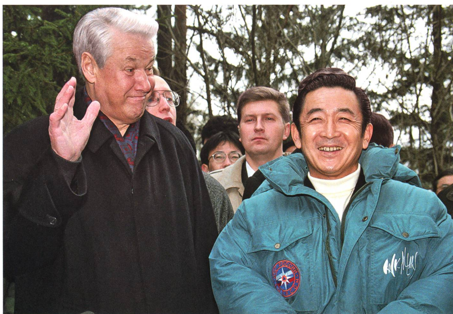
Der russische Präsident Boris Jelzin und der japanische Ministerpräsident Ryutaro Hashimoto, 1977.

Auf ihrer Konferenz in Kairo, Ende 1943, hatten die Alliierten festgelegt, das Kaiserreich müsse alle Gebiete aufgeben, die es mit «Gewalt und Habgier» erworben hätte; dabei wurde die Kurilen-Frage nicht genannt. Seit 1946 fordert Nip-