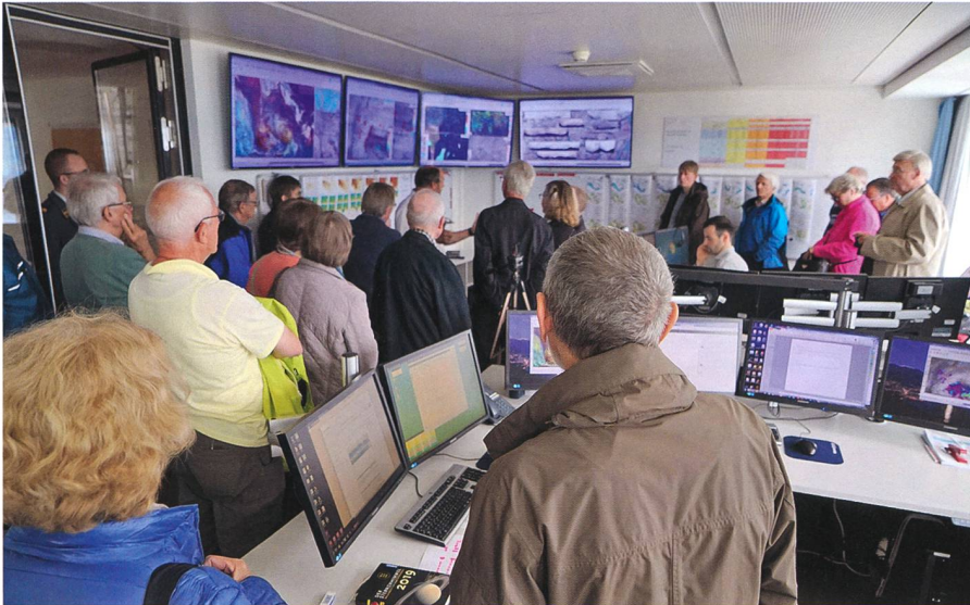
Die Jahresversammlung 2019 fand in den Räumen des Osservatorio Ticinese in Locarno-Monti statt.