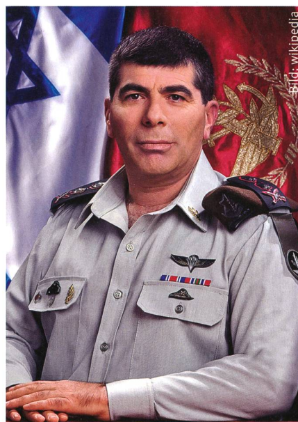
Der israelische Aussenminister Gabi Ashkenasi: «Historische Gelegenheit».

56 ehemalige israelische Abgeordnete, vorwiegend aus linken und liberalen Parteien, warnten vor der «Schaffung eines Apartheid-Staates». 220 ehemalige is-