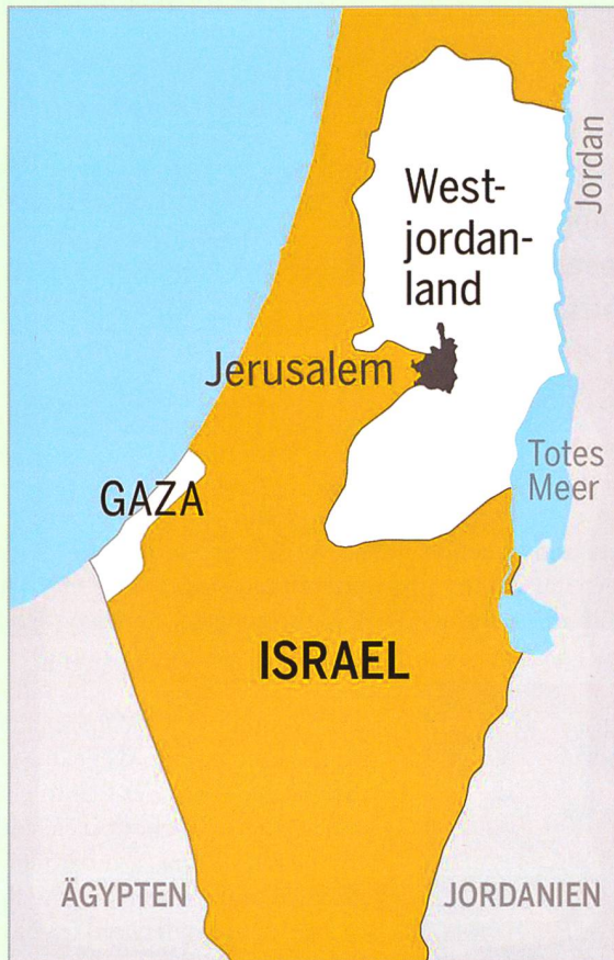
Grafik: sbr