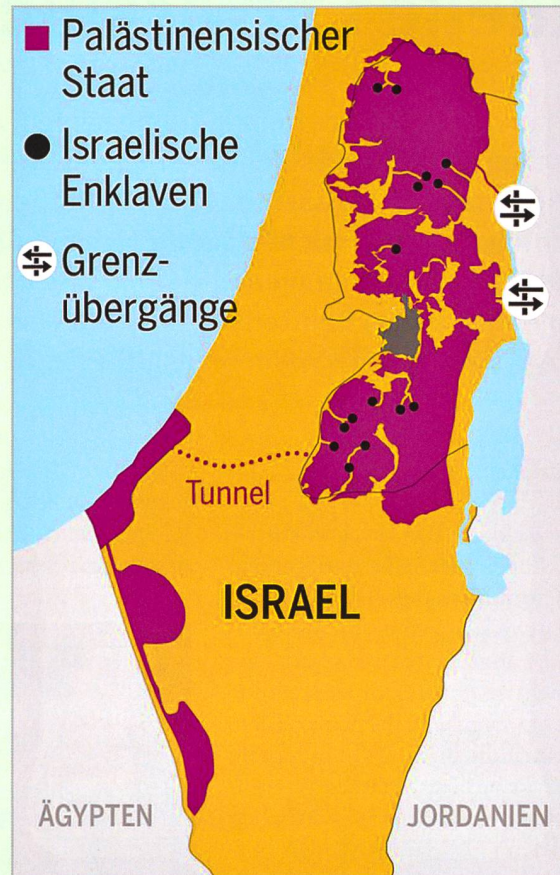
Der US-Friedensplan.

wortung für die besetzten Gebiete übernehmen. Man mache Amerika dabei als Partner einer Besatzungsmacht «voll verantwortlich für die Unterdrückung des palästinensischen Volkes». Dies schlies-