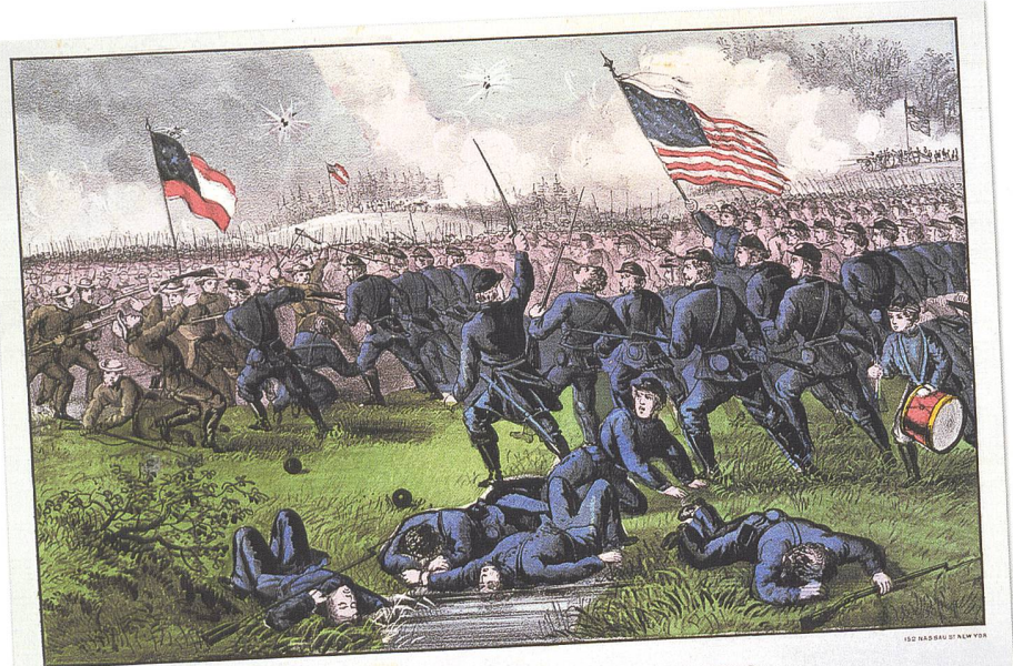
BATTLE OF CORINTH, MISS. OCT. 4 th 1862. Between the Federal troops under Genl Grant and the combined Rebel forces, under Genl Van Horn, Price and Lovell; the Rebels were utterly defeated and driven from the field, throwing away their arms and accoutrements and every thing that could impede their flight.