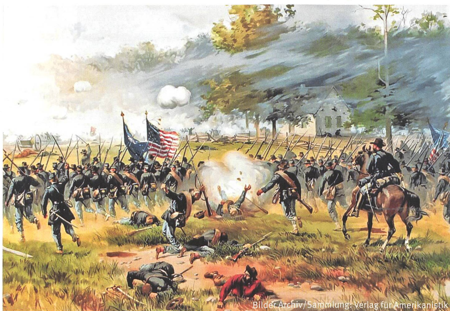
Schlacht bei Mill Springs (KY).