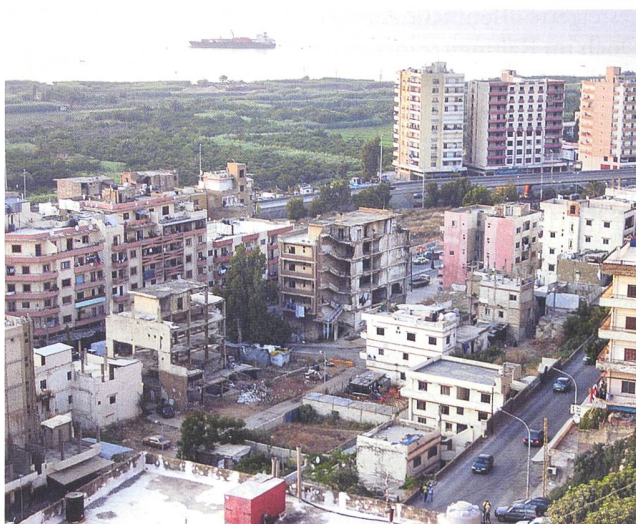
Tripolis wird seit einem Jahr von den Truppen des Ex-Generals Haftar belagert.

In einem Brief der Aussenminister von Frankreich, Italien, Deutschland und des EU-Aussenbeauftragten, sowohl an Warlord Haftar als auch an den Ministerpräsident Sarradsch gerichtet, hiess es: «Wir rufen Sie dringend dazu auf, von jeder weiteren militärischen Aktivität im ganzen Land abzusehen» und es wurde «eine humanitäre Feuerpause [...] und sich auf einen dauerhaften Waffenstillstand für den gesamten Zeitraum der Pandemie und darüber hinaus zu einigen» angemahnt. Der Brief, datiert vom 3.4.2020, blieb aber seither ohne Konsequenzen im Bürgerkrieg. Auf der Libyen-Konferenz Mitte Januar 2020 in Berlin hatte die deutsche Bundeskanzlerin Merkel in Bezug auf