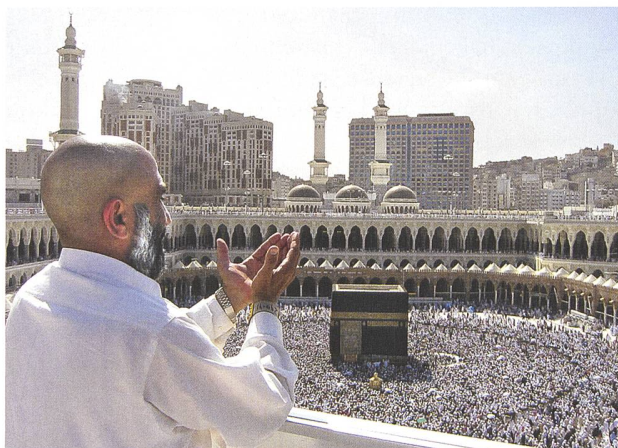
Der Haddsch nach Mekka wird 2020 wegen Corona abgesagt.

Die Corona-Pandemie von historischem Ausmass kann als weltweiter sicherheitspolitischer Katalysator fungieren und zahlreiche sicherheitspolitische Probleme mit weitreichenden Folgen auslösen: Potenziell fortgesetzte und sogar noch intensiviertere Kriege, eine Verstärkung von Konflikten wie beispielsweise zwischen Saudi-Arabien und dem Iran, Bürgerkriege und humanitäre Katastrophen. ■