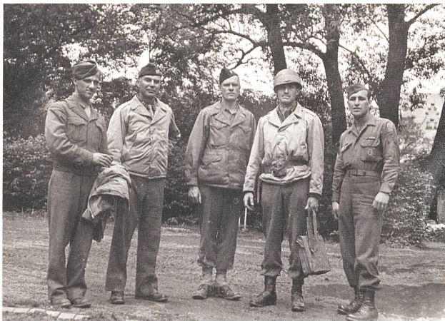
The Monuments Men.

In diesem Artikel wird versucht, eine Brücke zu schlagen und die Anregung in den Raum zu stellen, den zivilen Ersatzdienst für Wissensgründe beizubehalten, gemäss Art. 59 BV der Bundesverfassung. Für andere «Ausstiegsgründe» ist