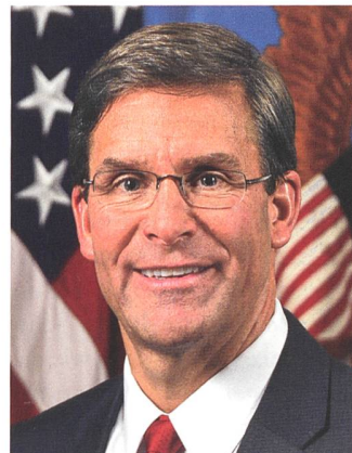
US-Verteidigungsminister Mark Esper.

150 km Entfernung Al-Quaim an der irakisch-syrischen Grenze.