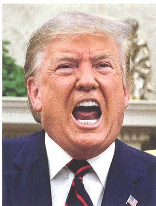
Präsident Donald Trump.

bunden fühlt. Die Demonstrationen im Irak und vor allem im Iran bei den Trauerfeiern für den getöteten General lassen erahnen, welche Massnahmen die iranische Regierung ergreifen könnte, um die Ermordung von Suleimani zu rächen. Der geistliche Führer des Irans, Ayatollah Khamenei, hat bei der Gedenkveranstaltung in Teheran geweint, und in Kerman, der Heimatstadt von Suleimani, ist es bei der Trauerfeier zu einer Massenpanik mit Toten und Verletzten gekommen.