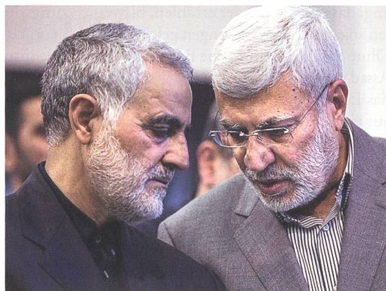
Abu Mahdi al-Muhandis, Chef der irakischen Popular Mobilisation Forces (re), mit Generalmajor Qasem Suleimani.