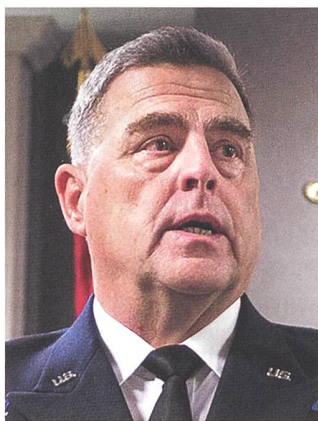
General Mark Milley, US Chairman of the Joint Chiefs of Staff.

In den Morgenstunden des 3. Januar 2020 landete Suleimani in einer Zivilmaschine auf dem Bagdad International Airport. Er kam aus Syrien und soll vorher im Libanon gewesen sein. Nach Insideraussagen war Suleimani in den Irak zurückgekommen, um in der Grenzstadt Al-Quaim an der Trauerfeier für 31 bei den amerikanischen Luftangriffen getöteten iraki-