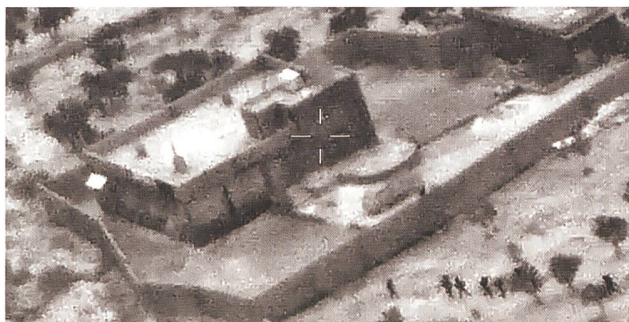
Foto von der Operation Kayla Mueller – dem Zugriff auf den IS-Kalifen Al Baghdadi.

Nach Aussagen des Präsidenten des deutschen Bundeskriminalamtes, Holger Münch, geht von Teilen der nach Europa zurückkehrenden dschihadistischen Foreign Fighters eine langfristige, kaum kalkulierbare Gefahr aus. 9 Dabei stellen