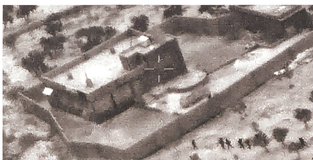
Foto von der Operation Kayla Mueller – dem Zugriff auf den IS-Kalifen Al Baghdadi.

Nach Aussagen des Präsidenten des deutschen Bundeskriminalamtes, Holger Münch, geht von Teilen der nach Europa zurückkehrenden dschihadistischen Foreign Fighters eine langfristige, kaum kalkulierbare Gefahr aus. 9 Dabei stellen