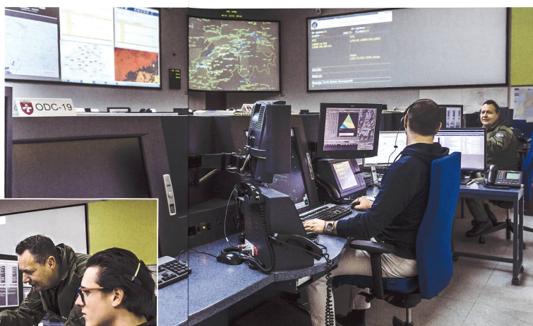
Herzstück der Luftwaffe: Einsatzzentrale Luftverteidigung.

fahr die Zentrale des Nachbarlandes zu alarmieren;