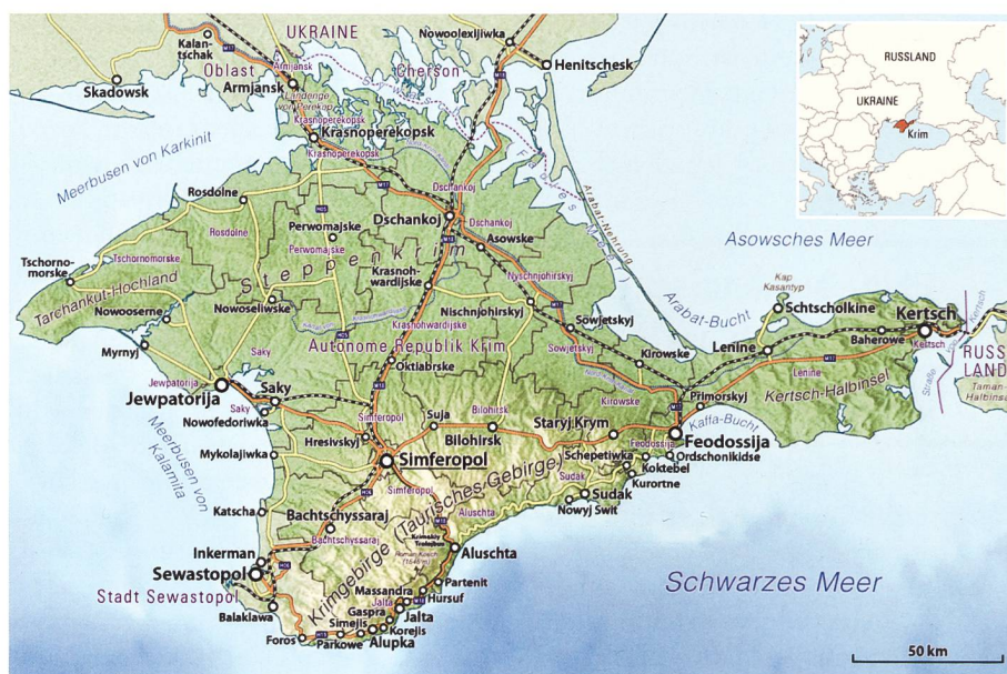
Halbinsel Krim.