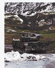
Panzer 87 Leopard II