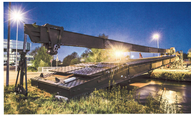
Nächtlicher Einbau einer 36 m langen Unterstützungsbücke.

Schwimmbrücke 95: Jede der beiden Pont Kp kann mit zehn Modulen und