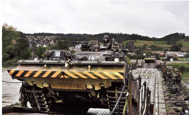
Ein Bergpanzer Büffel (65t) überquert bei Rottenschwil AG die Reuss über eine Schwimmbrücke 95. Im Hintergrund ein Pionierpanzer Kodiak.

vier Rampen eine Brücke von 100 m Länge und einer Fahrbahnbreite von 4,2 m bauen. Alternativ kann mit den Pontonmodulen auch ein Fährbetrieb aufgezogen werden, mit welchem ebenfalls schwere Kampfpanzer oder Panzerhaubitzen übersetzt werden können. Dieses moderne französische Brückensystem besteht durch seine rasche Einwasserung ab Lastwagen. Die Pontonelemente gleiten ab den Fahrzeugen direkt ins Wasser. Im Gegensatz dazu braucht die französische