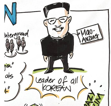
Abb.1: Kim Jong-un und sein Korea (Detail aus Abb.3).

und, viel entscheidender, die Kim-Dynastie stärken (Abb.1). Die drei interkoreanischen Gipfeltreffen im Jahr 2018 sowie die ebenfalls 2018 erstellte Panmunjom «Declaration for Peace, Prosperity and Reunification of the Korean Peninsula» sind erste Zeichen für eine Wiedervereinigung nordkoreanischer Prägung. Die internationalen Drohungen, die machtpolitischen Manöver und die Nuklearstrategie sind in diesem Zusammenhang eigentlich nur Begleiterscheinungen. Was sind die Beweggründe, die einen solchen