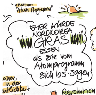
Abb. 2: Das Atomprogramm voranbringen (Detail aus Abb. 3).

Pjöngjangs Strategie einer Nordkoreanischen Moderne als Leitkultur ist in diesem Sinne beste Symbolpolitik und eine gute Projektionsfläche für das südkoreanische Volk. Südkorea ist ein Land, welches lange von der Globalisierung profitieren konnte und nun durch Handelskriege (u.a. mit Japan) deren Kehrseite zu spüren bekommt.