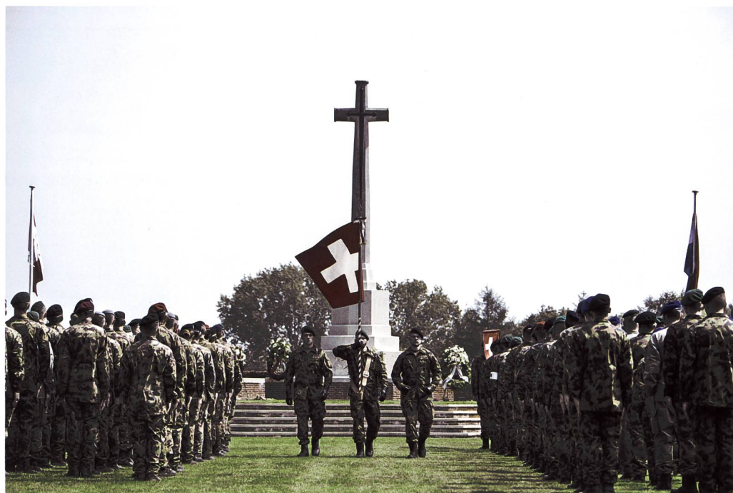
Das Schweizer Marschbataillon bei der jährlichen Kranzniederlegung auf dem kanadischen Soldatenfriedhof in Groesbeek.

Wenig später beginnt der Ausmarsch. Musikalisch wird er von der Heeresmusik Ulm begleitet. Im Gleichschritt marschiert das 155-köpfige Bataillon an den gigantischen Stiefeln vorbei, welche den Ein- bzw. Ausgang zum Camp dominant markieren. Dann kehrt die angenehme Ruhe zurück. Die ersten 850 Meter marschieren die Militärs durch einen zum 600 Hektar grossen