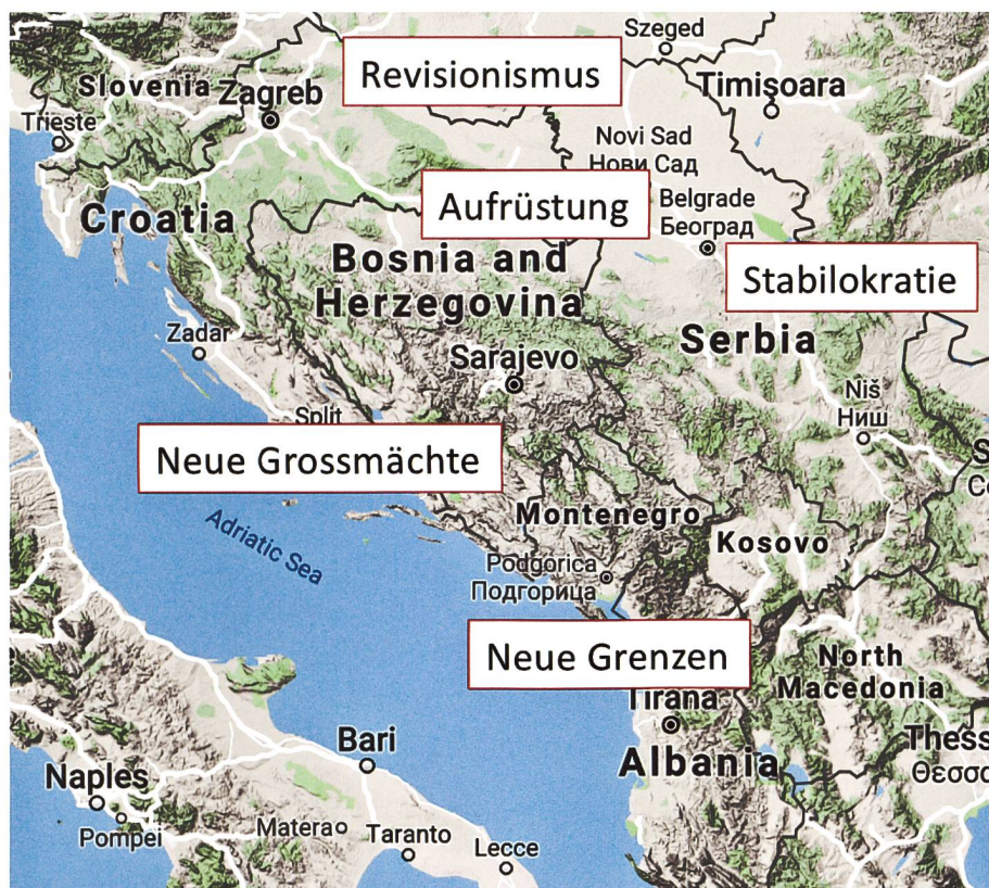
Fragile Lage auf einer geopolitischen Verwerfungszone.

zu einer denkbaren Option zur Beilegung des Konflikts zu werden.