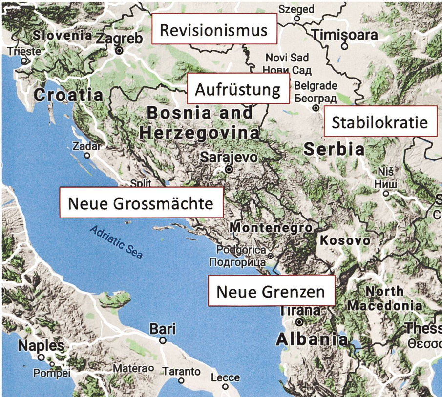
Fragile Lage auf einer geopolitischen Verwerfungszone.

zu einer denkbaren Option zur Beilegung des Konflikts zu werden.