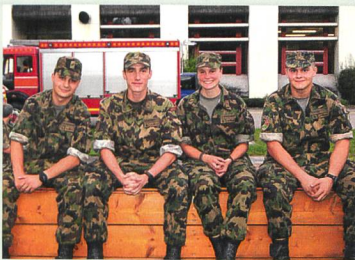
10 Als Frau in die Armee