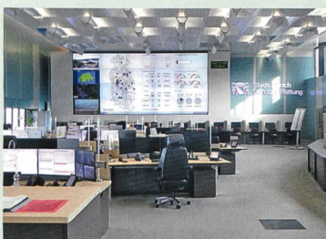
24 Einsatz-Leitstelle Schutz und Rettung Zürich