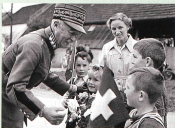
35 General Guisan