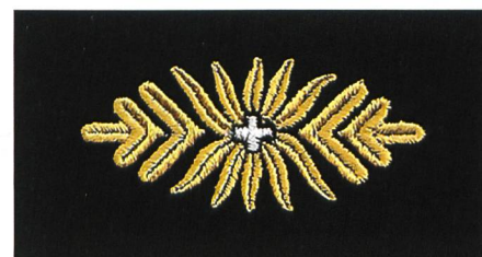
Versuchstyp einer Blattrosette für Kragenspiegel Gst Of, Ordonnanz 1949.

Historischer Reiseführer 200 Jahre ZS/HKA: Details unter: www.armee.ch/200-jahre-zs . Die Kapitel können als PDF heruntergeladen oder beim Kdo HKA in Printversion bezogen werden.