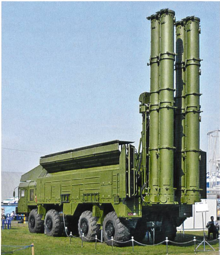
Modifiziertes Abschussfahrzeug mit vier Startvorrichtungen für 9M729.

Unterschied zu den früheren Versionen verfügen die neuen modifizierten «Iskander»-Abschussfahrzeuge über vier, anstatt der bisher nur zwei Startvorrichtungen. Damit können die ebenfalls containergestützten Marschflugkörper vom neuen Typ 9M729 mitgeführt und abgeschossen werden. Die geschätzte Reichweite der neuen Lenkwaffen soll gemäss amerikanischen Quellen zwischen 500 und mindestens 2600 km liegen und soll dadurch den INF-Vertrag deutlich verletzen. Russland streitet dies ab und spricht von einer maximalen Einsatzdistanz von lediglich 480 km. Der 9M729-Flugkörper ist mit einem Feststofftriebwerk ausgerüstet; die Flughöhe soll je nach Einsatzart variabel zwischen 100 und 6000 Meter liegen. Gemäss Herstellerangaben soll das Lenkverfahren mittels Satellitennavigationssystem «GLONASS» erfolgen. Die Rakete verfügt zudem über eine Reihe von Systemen zur Überwindung gegnerischer Abwehrmassnahmen. Wahrscheinlich sind die neuen Marschflugkörper in der Lage, auch bewegliche Ziele zu treffen, da die Zielkoordinaten während des Fluges angepasst werden können. Gemäss russischen Angaben wurde die neue Lenkwaffe 9M729 erstmals anlässlich der Manöver Zapad 2017 aus dem Testgelände Kapustin Jar abgeschossen. Dort soll