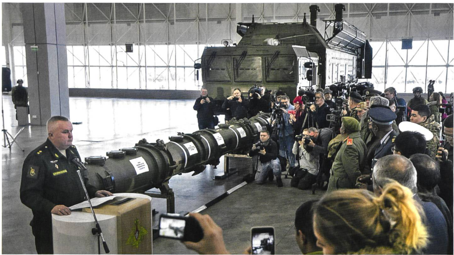
Präsentation des neuen Marschflugkörpers 9M729 durch das russische MoD.

igkeit sowie über leistungsfähigere Gefechtskopftypen verfügen. Zudem muss angenommen werden, dass damit auch ein atomarer Gefechtskopf eingesetzt werden kann. Kurz vor Ablauf des US-Ultimatums hatte Russland Ende Januar 2019 das neue Waffensystem im Testzentrum Kubinka bei Moskau ausländischen Militärs und Fachjournalisten präsentiert. Allerdings wurden dabei teilweise widersprüchliche Angaben zur Leistungsfähigkeit der neuen Waffe gemacht. Im