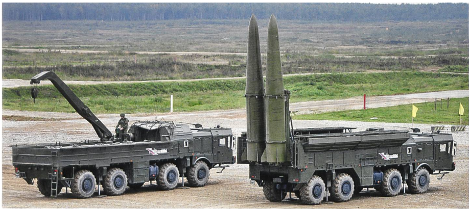
Raketensystem «Iskander-M» mit Nachladefahrzeug.