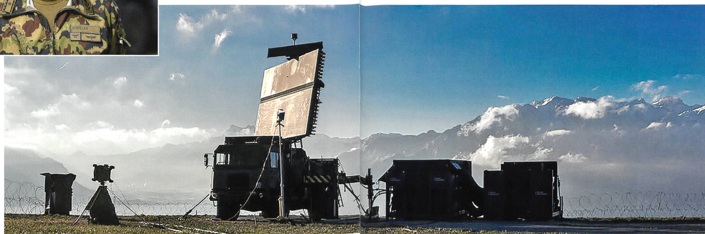
Abbildung rechts: Taktischer Fliegerschirm (TAFLIR) im Einsatz.