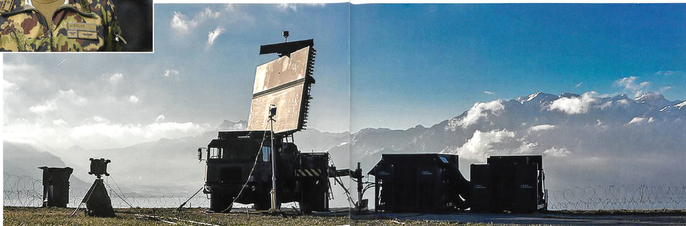
Abbildung rechts: Taktischer Fliegerradar (TAFLIR) im Einsatz.

Mit der WEA wurden ja zwei verschiedene Lehrverbände zusammengeschweisst. Wie verlief die Hochzeit zwischen den Fliegertruppen und den technischen Milizeinheiten der Führungsunterstützung?