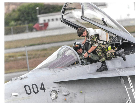
Fliegersoldat unterstützt den Piloten bei den Flugvorbereitungen.

Das passt absolut dazu. Diese Devise kommt ja aus dem Wallis, aus Savièse. Durch die Gebirgslage stiess die Bevölkerung auf massive Schwierigkeiten, um die Wasserleitungen im Gebirge zu verlegen. An nahezu überhängenden Felswänden wurden kleine Wasserkanäle und -leitungen gezogen. Pa Capona heisst nicht aufgeben, weiterkämpfen, weiter machen, und ich glaube, dass es eine sehr gute Devise ist, um auch in Zeiten des Umbruchs das Ziel vor Augen zu behalten. Wissen, wo man hin will, wo man hin muss, was man zu tun hat, auch wenn man auf Hindernisse stösst. Das ist generell ein gutes Lebensmotto. ■