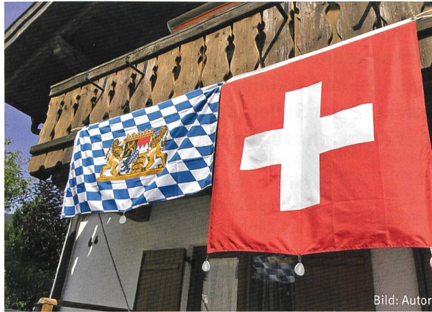
Schweizer Präsenz in Oberammergau.

Aufgrund meines fast dreijährigen Aufenthaltes in der NSO und im «internationalen Klassenzimmer» sehe ich den Mehr-