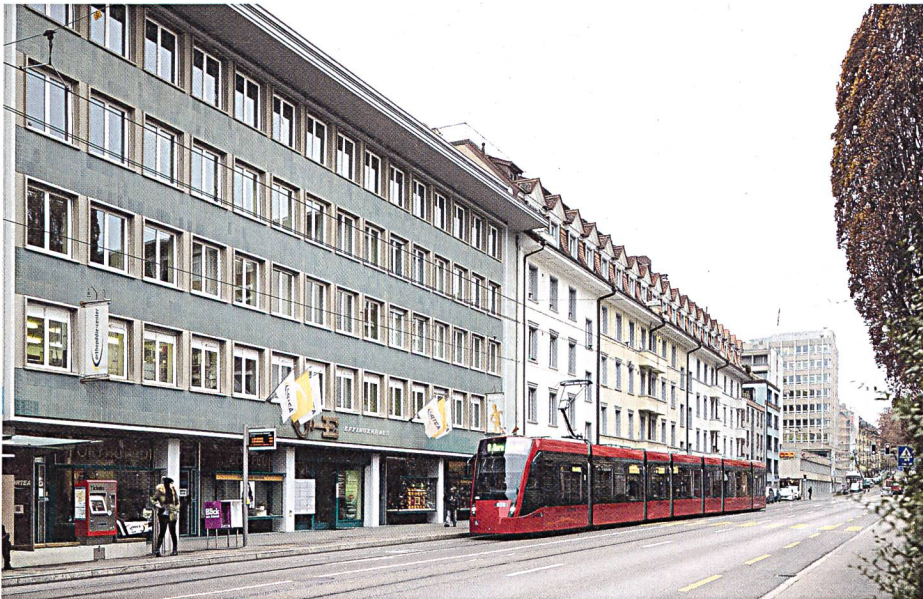
Geschäftssitz der SNS in Bern