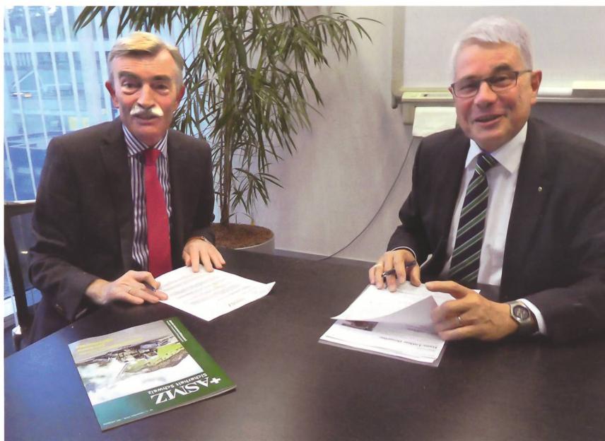
General Domröse und der Chefredaktor im angeregten Gespräch.

Wir haben das Niederschlagen des Arabischen Frühlings in Syrien erlebt. Das hat zu diesem achtjährigen Krieg geführt mit unendlich vielen Flüchtlingen, von denen sich allein in der Türkei fast vier Mio. aufhalten. Mittendrin in diesem Unruheherd liegt Israel. Der lachende Dritte ist nicht der Iran, sondern Israel. Dies, weil wir im Rahmen der ganzen Verzahnung der Konflikte zwischen Saudi-Arabien und dem Iran, dem Syrien Krieg und dem Konflikt zwischen den Kurden und der Türkei den Blick auf Israel ein wenig verloren haben. Wer weiss, ob es im Nachgang zu einer