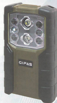
Die neue Taschenlampe der CH-Armee