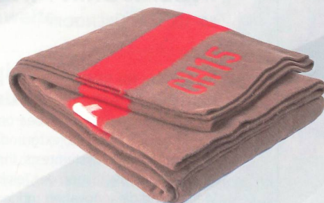
Neuaufgabe der Wolldecke der CH-Armee