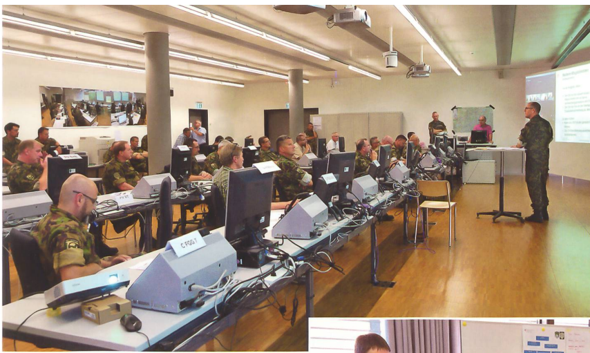
Die Lageverfolgung ist im Einsatz der Schlüssel zum Erfolg.

Leistungserbringung zusätzlich und führte dazu, dass in Absprache mit dem Kommando Operationen die Aufträge stark priorisiert werden mussten. Als dritte Herausforderung musste zusammen mit der Landesversorgung und der zivilen Wirtschaft das zivile, nationale Potenzial für die Auftragsbefriedigung der Armee analysiert und erschlossen werden, ohne dass die Zivilbevölkerung übermässig darunter leiden durfte. Das Recht der Armee zur Requisition im Aktivdienst kam zur Anwendung.