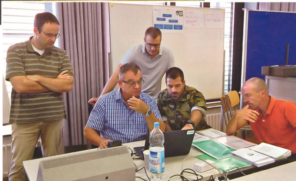
Durchmischte Teams suchen gemeinsam nach Lösungen.

Die LBA stellt mit ihren rund 3000 Mitarbeitenden und den 12000 Milizangehörigen der Logistikbrigade 1 der Truppe das Material und die Infrastrukturen für Ausbildung und Einsatz bereit und hält es instand. Weiter arbeitet die LBA die Logistikkategorie für die Armee aus, managt die Betreiberleistungen aller Systeme auf dem gesamten Lebensweg, führt den Truppenhaushalt und erstellt im Strassenverkehrs- und Schifffahrtsamt die Grundlagen für militärische Fahrzeuge und ihre Führer.