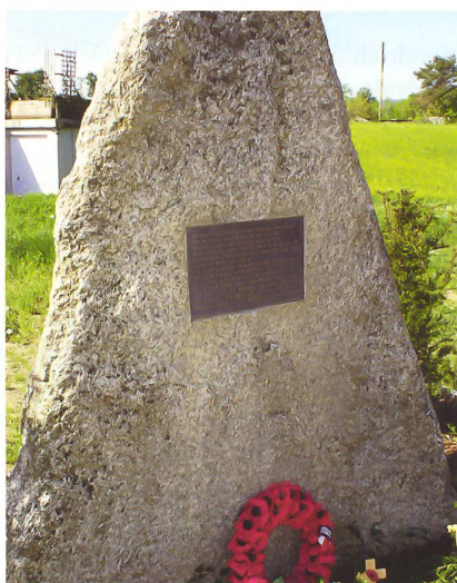
Ein Gedenkstein erinnert an den Absturz des R.A.F.-Bombers in Birmenstorf vor 75 Jahren, am 15. April 1943.

Die beiden abgestürzten Kampfflugzeuge hatten ein ähnliches Schicksal, indem sie bei einem Angriff auf Stuttgart respektive Innsbruck getroffen wurden und eine Notlandung in der Schweiz suchten. Während die englische Maschine in der mond hellen Aprilmacht unbefallig in den schweizerischen Luftraum einflog, nahm die Schweizer Luftabwehr den amerikanischen Bomber unter Beschuss, weil sich die Crew wegen Explosionsgefahr nicht mehr getraute, ihre friedliche Landeabsicht mit einer Signalarakete zu markieren.